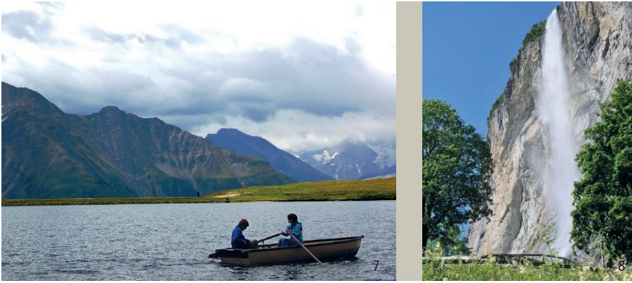
Abbildung 7: Rudern auf dem Bettmersee, Kanton Wallis. Landschaftsräume mit Wasser bieten eine hohe Erlebnisvielfalt und sind deshalb beliebte Erholungsgebiete. Das Wasser – sei es als kühles Nass, tiefes Blau, gischtender Bergbach oder frisches Quellwasser – ist mit allen Sinnen erlebbar.