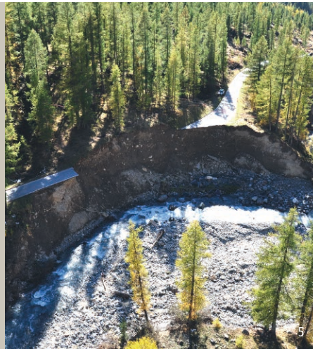
Abbildung 4: Das Auengebiet im Gasteretal, Kanton Bern. Der saisonal ändernde Wasserstand der Kander schafft eine besondere Landschaft. Hochwasser, Erosion und Sedimentation wechseln sich ab. Wo Gebiet überflutet wird, entstehen – vorübergehend – Kies- und Schotterflächen. Wo Flächen seit längerem trocken liegen, breiten sich Pionierpflanzen und Jungwald aus. Durch die Vielzahl an Lebensräumen beherbergen die Auen eine grosse Artenvielfalt.