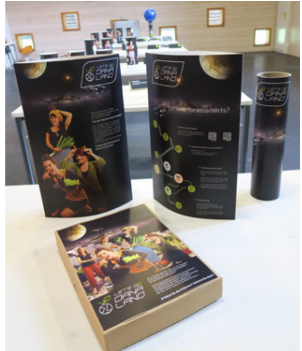
2: Hier sehen Sie das fertig aufgebaute Spiel mit Plakat und Spielanleitung im Vordergrund