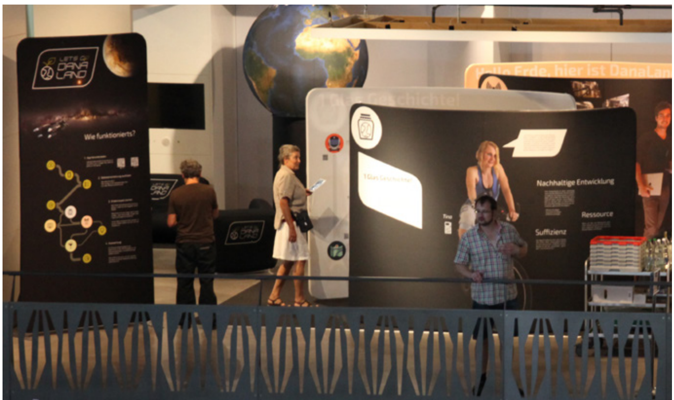
3: Links sehen Sie die Spielanleitung, rechts eine Stellwand mit Zusatzinformationen zum Thema Suffizienz und gutes Leben