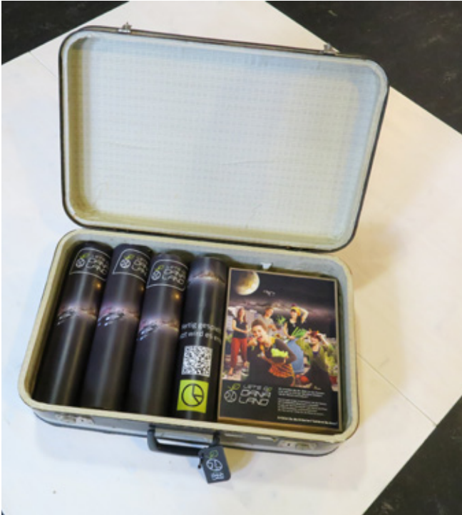
1: So trifft der Reisekoffer bei Ihnen ein