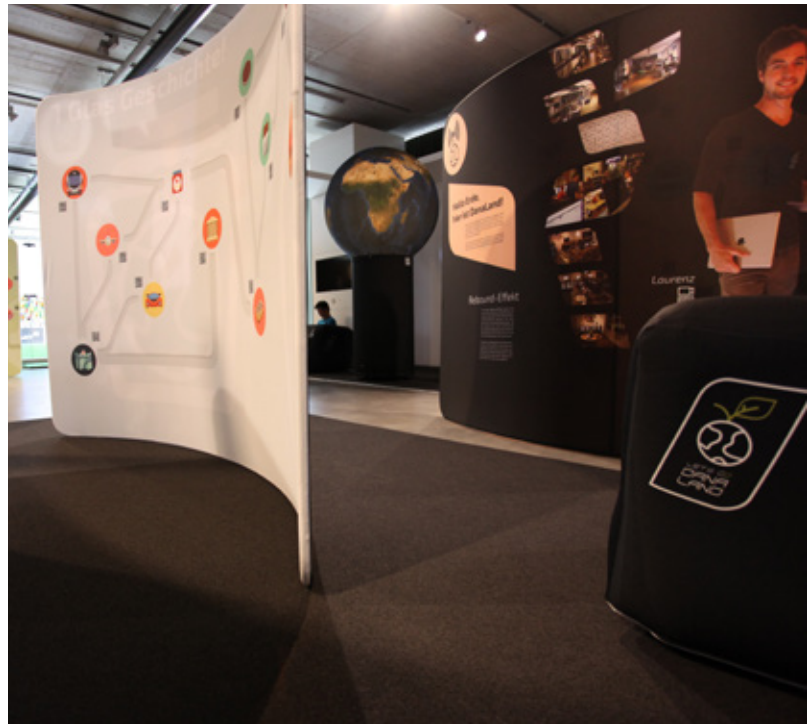
2: Auf der linken Seite sehen Sie eine Spielstellwand; im Hintergrund die Weltkugel, bei der die Auswertung der Antworten erfolgt