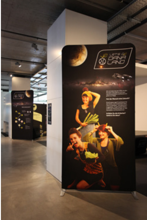
1: Bei dieser Stellwand beginnen Sie die Ausstellung