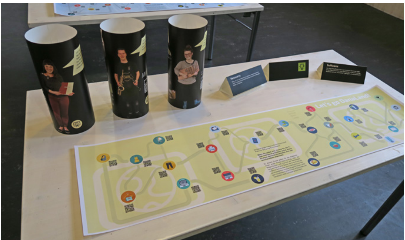
3: Und so sieht ein „Spiel-Tisch“ aus: Spielfläche, AssistentInnen und Zusatzinformationen