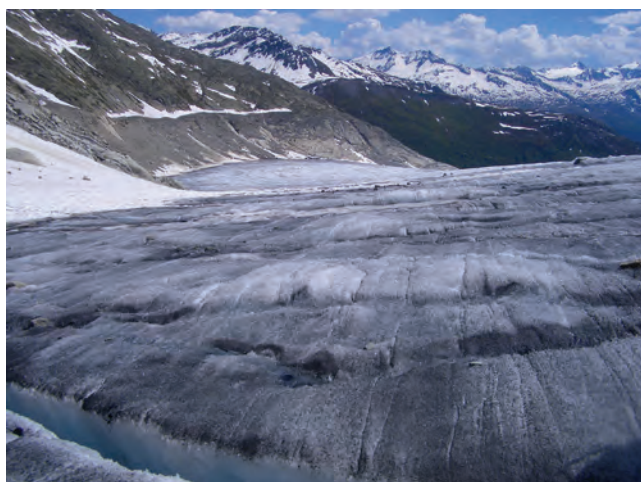
Figure 3: Les glaciers alpins témoignent les conséquences du réchauffement climatique.